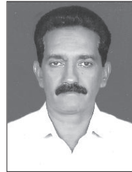
Joseph J. M. Presudhenti