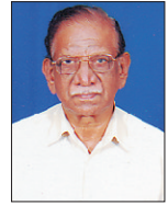
പി. എം. ജോൺ ഹോളിഫാമിലി യൂണിറ്റ്

ഈശോ നാഥന്റെ പൊൻതിരുനാമം സ്വർഗ്ഗവും ഭൂമിയും വാഴ്ത്തും നാമം അളവറ്റ നന്മകൾ വിളയും വിശുദ്ധിതൻ ആലയമാണോ പുണ്യ സന്നിധാനം ദേവാലയമാണോ പുണ്യ സന്നിധാനം