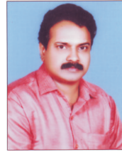
ഡോൺ ബോസ്കോ Don Bosco Unit

റോമാ, ഗലാത്തയെ, ഫിലിപ്പി, കൊളോസസ് തുടങ്ങിയവങ്ങളിൽ തിരുരക്തത്തിന്റെ വിശ്വാസ പൊലിമയിൽ വിശുദ്ധ വിത്തുകൾ പാകി, പിന്നീടവരുടെ - കൂട്ടായ്മകളെ ഉപദേശിച്ചും ശക്തിപ്പെടുത്തിയും മാർഗ്ഗനിർദ്ദേശങ്ങൾ നൽകിയുമെഴുതി അമൂല്യ ലേഖനങ്ങൾ. പുതിയ സാമൂഹ്യ പാഠ്യക്രമങ്ങൾ ജനസമൂഹത്തിനു നൽകി കാരാഗ്രഹ ബന്ധനകാലത്ത് അനുചരരായ പ്രിയ- തീമോത്തിയോസിനും യവനനായ തീത്തോസിനും ഫിലേമോനും എഴുതിയ സാന്ത്വനം നൽകുന്ന എഴുത്തുകൾ വേറെയും. മിശിഹായുടെ അധരത്തിൽ നിന്നും വചനം ശ്രവിച്ചില്ലെങ്കിലും ഒടുവിലത്തെ തിരുവത്താഴത്തിൽ പങ്കുപറ്റിയില്ലെങ്കിലും ഗാഗുൽത്തായിലെ ഭോദനങ്ങൾക്ക് സാക്ഷിയായില്ലെങ്കിലും തോമായെപ്പോലെ ഈശോയുടെ തിരുവിലാവിൽ തൊട്ടുവിശ്വസിച്ചില്ലെങ്കിലും ശിഷ്യന്മാരേക്കാളും ശ്രേഷ്ഠശിഷ്യനായി പൗലോസ് ! താർസോസിലും ജറുസലേമിലും ജീവിച്ചവൻ എബ്രായരിൽ എബ്രായൻ തറവാടികളിൽ തറവാടി സ്വയം ഏറ്റുപറയുന്നു - ഈശോയുടെ അപ്പോസ്തോലൻ ! പ്രാദേശിക സിനഗോഗുകളിൽ നിന്നും അകറ്റപ്പെട്ട നവവിശ്വാസ- സ്നേഹികൾ പ്രാർത്ഥിക്കുവാനും അപ്പം മുറിക്കുവാനും ഭവനങ്ങളിൽ ഒത്തുചേരുക പതിവായി അക്കാലങ്ങളിൽ നൂറുനൂറു നൂറ്റാണ്ടുകൾ പഴക്കിയ യഹൂദമത പാരമ്പര്യം വെട്ടിമുറിക്കപ്പെട്ടതിന്റെ മുറിവുകൾ വച്ചുകെട്ടി തായ്വേരിന്റെ തഴക്കദോഷങ്ങൾ തിരുച്ചോരകൊണ്ടു കഴുകി മതമൗലിക സിനഗോഗുകളിൽ നിന്നും പേരുവെട്ടിയവരുടെ - അന്യസ്ഥതകൾ വചനശുശ്രൂഷയിലൂടെ ശാന്തമാക്കി നവബോധം വിളംബരം ചെയ്ത ശിഷ്യന്മാർ, ജനങ്ങളുടെ - വേവലാതികൾക്കു നടുവിലും ഉള്ളുണർന്ന് ബലിയർപ്പിച്ചു പഴയതിൽ നിന്നും പുതിയതിലേക്ക് ഉടച്ചുവാർക്കപ്പെട്ടവരുടെ - സംരക്ഷണവുമന്ത്സ്യം ആനുകൂല്യങ്ങളുമെല്ലാം നിത്യനായ നീതിസൂര്യന്റെ കൈകളിൽ ഭദ്രം ! പുതുചട്ടക്കൂടുകളുടെ കരുത്തും തുടർച്ചയും ഈശ്വര നിശ്ചയം !! പൗലോസിന്റെ പുറയം സ്വകാര്യ വിചാരങ്ങളാൽ വിതുമ്പി.