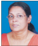
Babykutty, Cherupushpam Unit